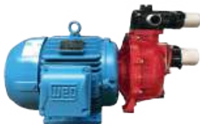
Electrobomba Alta Presión 3"x3" Modelo HP80