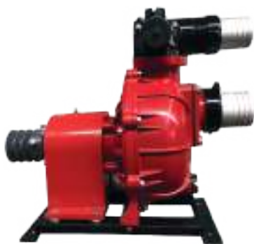
Bomba Alta Presión 3"x3" Modelo HP80 en Versión eje libre

* Las curvas de rendimiento variarán dependiendo de la zona geográfica de trabajo. Curva en base a no más de 1,000 msnm.