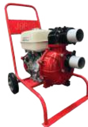
Motobomba Alta Presión 3"x3" Modelo HP80

Jopco se reserva en todo momento la libertad de modificar aspectos técnicos o estéticos de las bombas